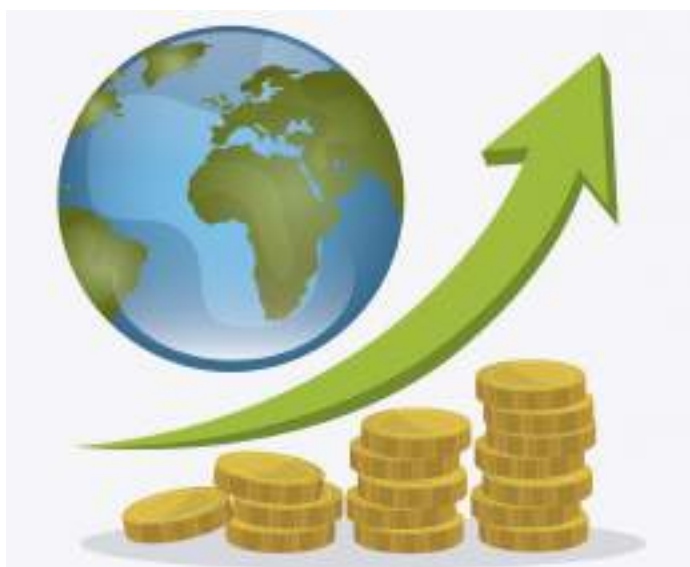
Immagine: studiogstock RIPRODUZIONE RISERVATA ©Copyright FOOD&TEC

Se il blocco di Hormuz a marzo aveva già determinato i primi rincari su carburanti, gas del mercato tutelato, voli aerei intercontinentali e alcuni tipi di frutta e verdura, ora ha avuto ripercussioni ben più pesanti e l'epidemia non solo si è diffusa, ma è destinata a espandersi nei prossimi mesi".