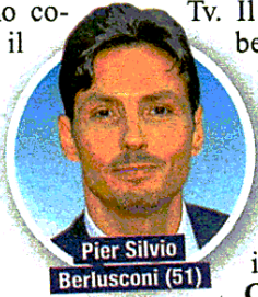
Pier Silvio Berlusconi (51)

N on c'è più limite. Il Grande fratello vip 5 rischia di essere ricordato per i tanti episodi ad alto tasso di violenza verbale e volgarità. E molti spettatori si chiedono come sia possibile che il programma vada in onda in prima serata quando davanti alla Tv non ci sono solo adulti, ma anche tanti bambini.